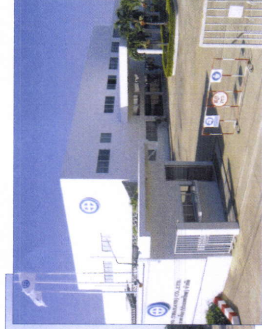
•FACTORY 2(โรงงาน 2) • 第二工場