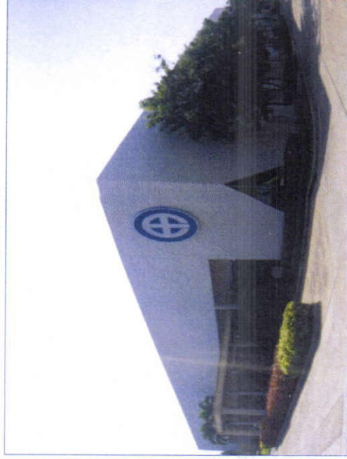
•FACTORY 1(โรงงาน 1) • 第一工場