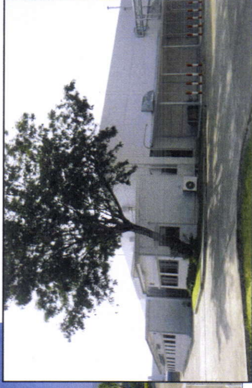
•FACTORY 3(โรงงาน 3) • 第三工場